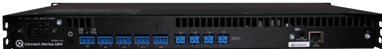
Connect 164 背面

Connect シリーズは、小規模から中規模の施設に適したパワーアンプです。2/4/8ch のラインナップで、それぞれに Dante 搭載モデルがあります。ローインピーダンスまたはトランスレス接続できるハイインピーダンス(70V/100V)の接続が可能で、各チャンネルごとに切り替えができます。Analog Devices 社製 96kHzDSP を搭載し、最大 48dB/Oct のクロスオーバーフィルター、8 バンド PEQ、スピーカー保護リミッターなど、多彩な機能を搭載しています。アンプへの接続には、内蔵の Wi-Fi アクセスポイントを使用する、既存 Wi-Fi ネットワークから接続する、または高速 10/100MB イーサネット接続する、の 3 つの方法があります。ソフトウェアのダウンロードが必要なく、Web UI で PC やモバイルデバイスからリモートコントロール、監視、通知など、多様な制御が可能です。さらに、クラウドからの接続も可能です。Connect シリーズは、LEA Professional Cloud(2020 年サービス開始)に対応した初めてのプロフェッショナルパワーアンプシリーズです。LEA Professional Cloud と Web UI を使用することで、監視や予防のシステムメンテナンスを遠隔で行うことが可能です。