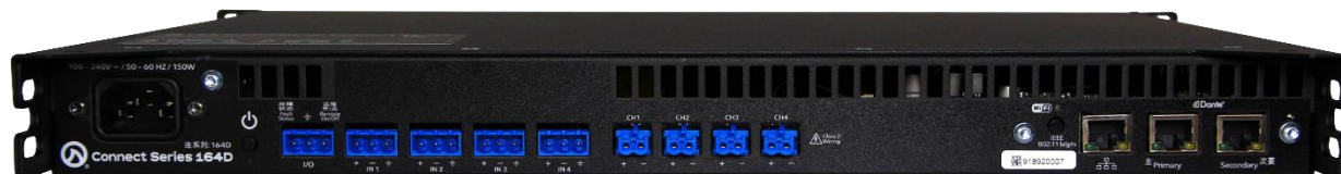
Connect 164D 背面